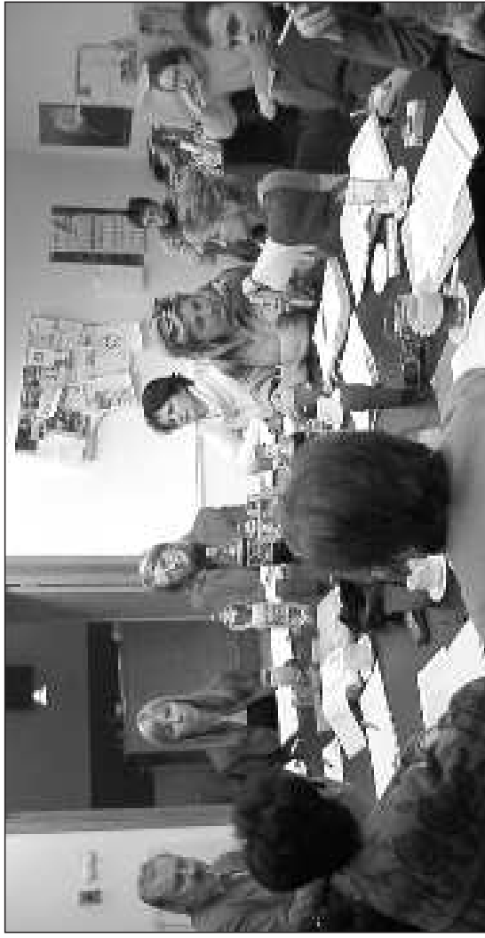
ОКОСП: У ПРАКСИ ДОКАЗАНА МОЋНОСТ КРЕАТИВНОГ И САМОСТАЛНОГ РАДА У ЛОКАЛНОЈ ЗАЈЕДНИЦИ