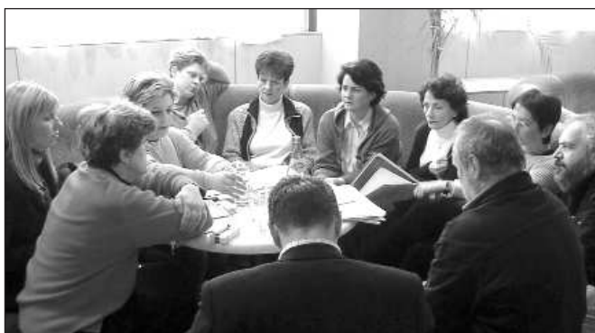
СТРАТЕШКИ ПЛАН ЈЕ РЕЗУЛТАТ КОЛЕКТИВНОГ РАДА

одабраних на јавном конкурс крајем 2003. године, а на основу искустава у реализацији 14 пројеката, и основ за данашњи садржај Стратешког плана. Оно што представља посебан квалитет оваквог начина рада јесте и одређење да је Стратешки план документ у развоју, и да он може током наредних година бити прилагођаван искуствима и потребама.