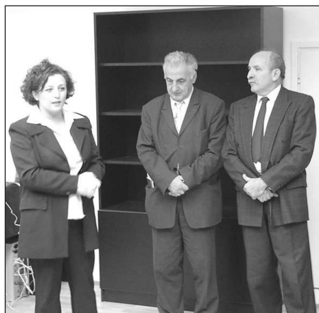
КАНЦЕЛАРИЈА ПРОЈЕКТА У КОСОВСКОЈ 9 ЈЕ ОТВОРЕНА 12. ДЕЦЕМБРА 2002. ГОДИНЕ

Усвајањем овог планског документа завршен је мукотрпан период постављања на ноге једног новог система рада и односа који превазилази значај појединачне области социјалне политике, због тога што представља модел децентрализованог вођења јавних послова и изградње цивилног друштва. По овом моделу, могуће је креирати политику и у осталим областима – здравству, образовању, култури... Због тога, овај Стратешки план, као први такав документ који је на локалном нивоу усвојен у Србији, представља догађај од значаја који се из ове перспективе може само наслућивати.