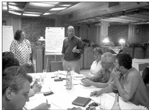
ПРВИ ПРИПРЕМНИ САСТАНАК ОДРЖАН ЈЕ 29-30. ЈУНА 2001. ГОДИНЕ У ДОМУ ВАЗДУХОПЛОВСТВА.

Одборници Скупштине општине Земун су једногласно, без обзира на партијске разлике, 25. априла усвојили Стратешки план за социјалну политику општине Земун за период 2005 – 2010. година. Била је то круна вишегодишњег рада тима чланова Општинског координационог одбора за социјалну политику.