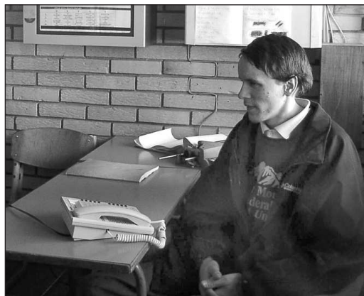
ОСИМ РАДА НА ТЕЛЕФОНСКОЈ ЦЕНТРАЛИ УЧЕНИЦИ ЗА СЛЕПЕ У ЗЕМУНУ СЕ ОСПОСОБЉАВАЈУ И ЗА ДРУГА ЗАНИ-МАЊА КОЈА СУ ПОТРЕБНА У НЕКИМ ПРОИЗВОДНИМ ПРОЦЕСИМА

Због повећаног обима посла у раду са лицима са посебним потребама и жеље да се смањи социјална дистанца према овим категоријама, у Београду је током прошле године основан Одсек за рад и запошљавање инвалидних лица при Националној служби запошљавања (НСЗ), једини такав у Србији, који се бави искључиво запошљавањем инвалидних лица са уже територије Београда. За сада мали тим, састављен од седам стручних лица, опслужује око 6.300 незапослених инвалида подељених по категоријама - инвалиди рада 2. и 3. категорије, ратни војни инвалиди, цивилне жртве рата, мирнодопски војни инвалиди и категорисана лица са завршеним специјалним школама, укључујући и оне са категорисаном инвалидношћу по рођењу. Како је међу корисницима њихових услуга значајан број лица са оштећеним слухом, због лакше комуникације са њима, стручни сарадници ове службе су са успехом завршили основни курс гестовног говора у Градској организацији глувих Београда.