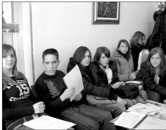
ЈЕДНА ОД РАДИОНИЦА: ПРИПРЕМЕ ЗА ПОКРЕТАЊЕ ШКОЛСКИХ НОВИНА

Очекивања по завршетку пројекта су смањење процента конзумента наркотика, спречавање „првог испробавања”, тако што ће поред елементарних информација ученици добити и простор у којем ће исказивати свој креативни потенцијал. Или, како рече једна ученица гимназије: „Сигурно нећеш бити наркоман ако никад не пробаш”. С. АВРАМОВИЋ